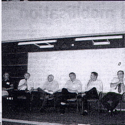
Un amphi complet avec 150 présents à Gardanne.