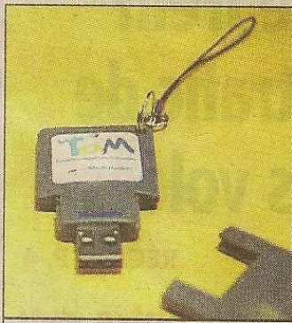
Testé en octobre.

Comment ça marche ? Il existe deux technologies. La première : une clé USB pour charger les titres de transports depuis son ordinateur, qui se valide sur les bornes à l'intérieur du tramway ; la seconde : un lecteur de carte à puce toujours connecté à son ordinateur dans lequel on insère sa carte à puce. Ingénieux pour un investissement de 300 000 €.